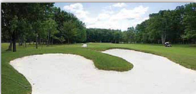
Le sable blanc (silice) dans les fosses sur le terrain et aux abords des verts, est l'une des particularités du club de golf de Cap Rouge.