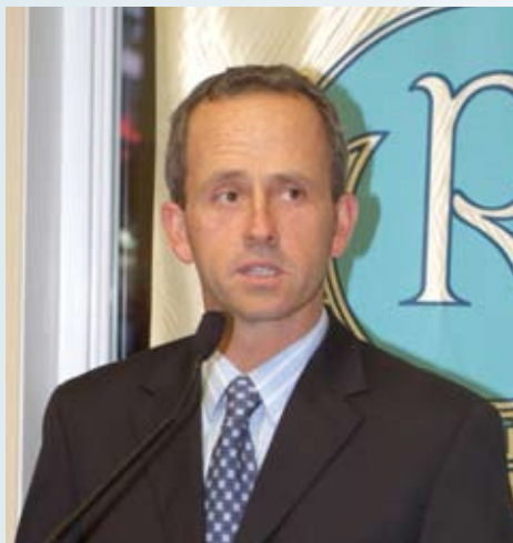
Claude lors d'une allocution à titre de président du Club Richelieu de Joliette.

This year, with the economic crisis, there are more people out there to meet our hiring needs, but that's just temporary. Sooner or later, these issues will rear their heads again and throw a monkey wrench into our operations.